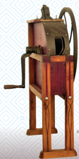
Engenho de milho Corn thresher Século XX / 20TH Century