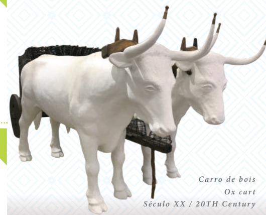
Carro de bois Ox cart Século XX / 20TH Century

MUNICÍPIO DE VELAS E A ASSOCIAÇÃO CULTURAL DAS VELAS APOIAM A CULTURA